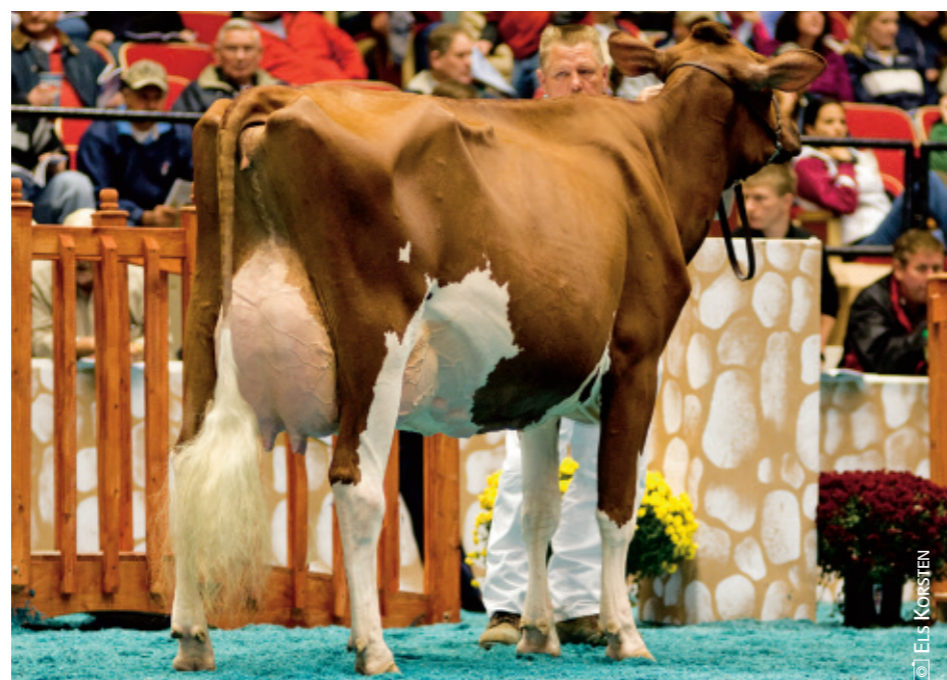
Reserve Champion à Harrisburg en 2008, Greenlea Mindy-Red EX-93 est la fille de Mandy générée par le fils de Rubens Chip-Red.

coup des meilleurs fils de Valiant, était d'une Elevation et qui laissait une stature et une longueur extrêmes, alors que ses filles avaient souvent tendance à être un peu étroites et pouvaient être mal dégrossies le long de la ligne de dos et grossières dans les pattes. Mali était un de ces animaux black/red qui ne pouvaient pas tout à fait cacher le fait qu'elle était née rouge, conservant une auréole autour du nez et une teinte brunâtre de ses poils. Il