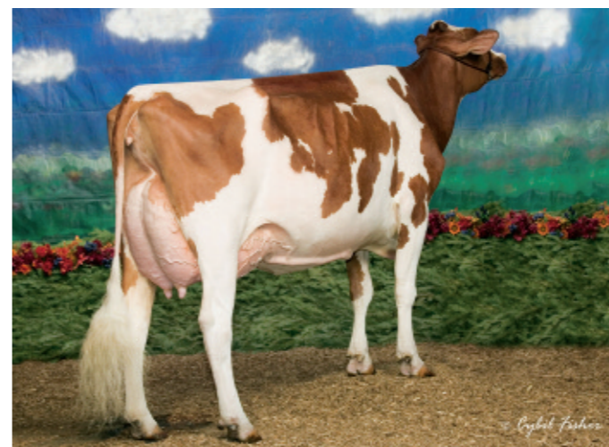
La 4e génération de la famille à remporter le All-American en condition de production: KY-Blue Ruben Marla-Red. Marla vèlera en juin, il faudra donc s'attendre à la voir dans les expositions majeures en 2009.