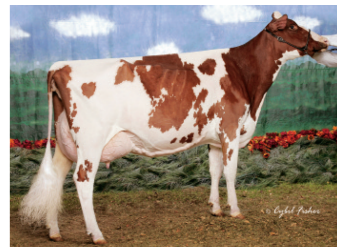
Elle n'est peut-être pas la plus grande, mais c'est certainement une des vaches les mieux équilibrées sur la scène des concours: Greenlea Rub Marlene-Red EX-94.